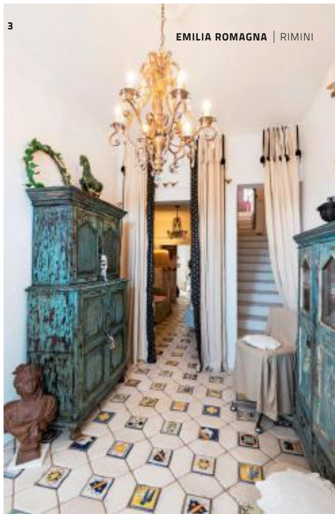
EMILIA ROMAGNA | RIMINI

Nella luce schiva del Tempio Malatestiano brilla l'oro del Crocefisso di Giotto, resta in penombra il ritratto di Sigismondo Malatesta di Piero della Francesca. In una chiesa sconsecrata di mattoni rossi si esplora un'antica villa romana con l'avatar di Giulio Cesare come guida. Firenze? Venezia? No, Rimini. Da riscoprire in un long week end fuori stagione e partendo lontano dal mare. Una caccia lungo canali e viuzze, dove il tesoro sono opere d'arte e siti archeologici di livello internazionale, una cucina che va molto oltre il fritto misto, botteghe giovani piene di idee. Magari seguendo l'Anello Rosso, che da ottobre collega con il suo asfalto porpora le piazze restaurate del centro. Sembra facile seguirlo, eppure ci si perde sempre, persino scaricando la mappa da riminiturismo.it . Perché la Rimini segreta è una piccola avventura.